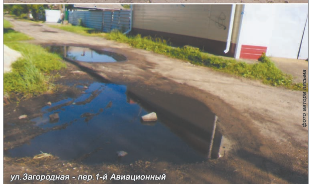
ул. Загородная - пер. 1-й Авиационный