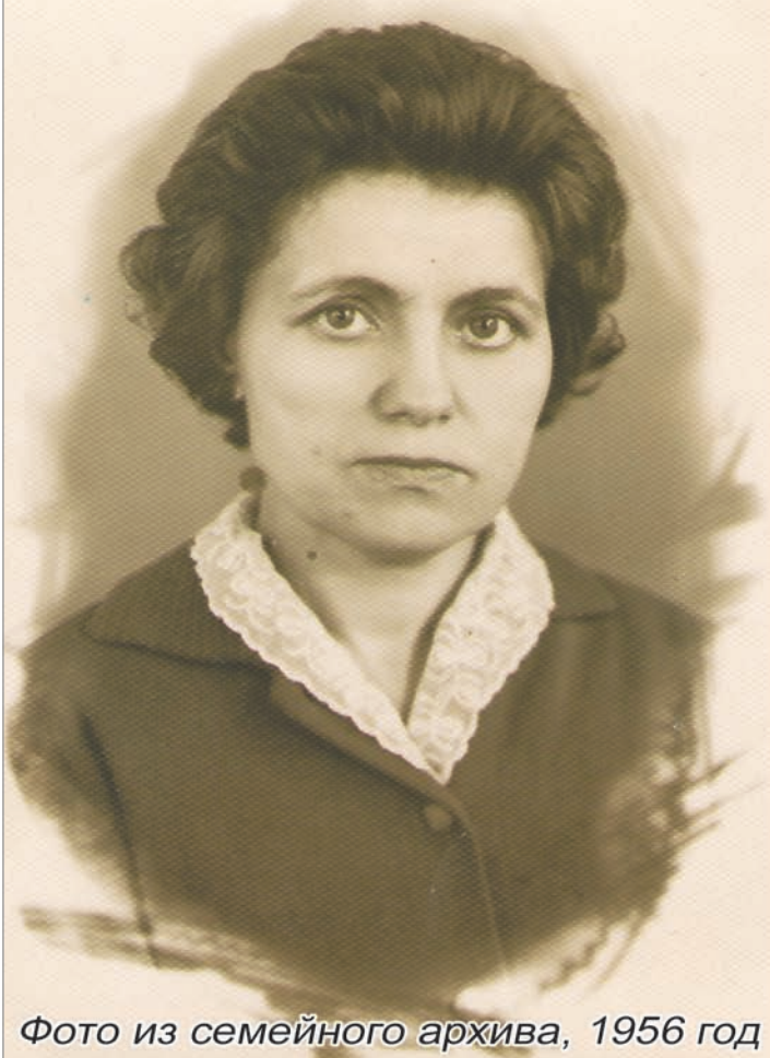
1956 год