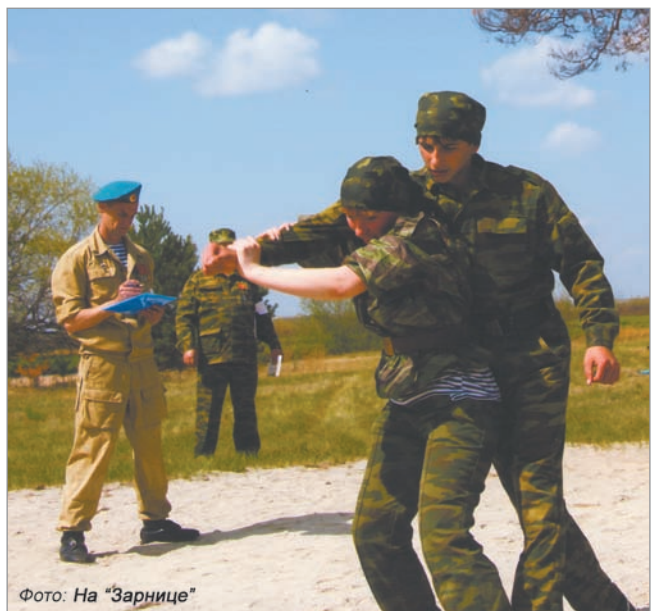
Фото: На «Зарнице»