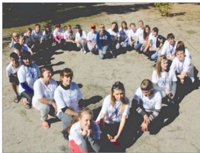
На фото: Добровольцы Амурской области дарят всем свои сердца!

Ключевым моментом образовательной программы стал процесс избрания молодёжного губернатора. За этот пост поборолось 9 человек, в числе которых были и три девушки. Самому молодому претенденту было 17 лет, самому старшему – 30. Реализовать игровой сценарий «Выборы» удалось при активной поддер-