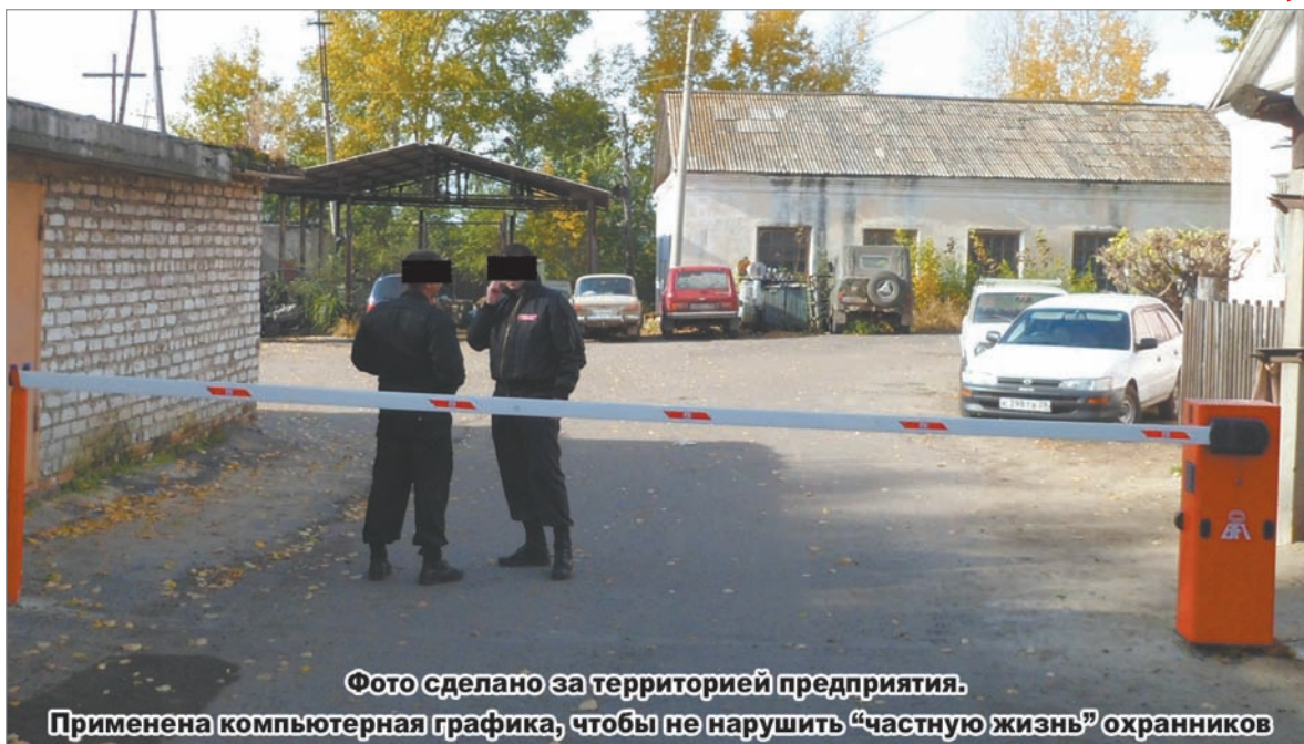
Фото сделано за территорией предприятия. Применена компьютерная графика, чтобы не нарушить «частную жизнь» охранников

К положенному времени им был сформирован реестр требований кредиторов должника,