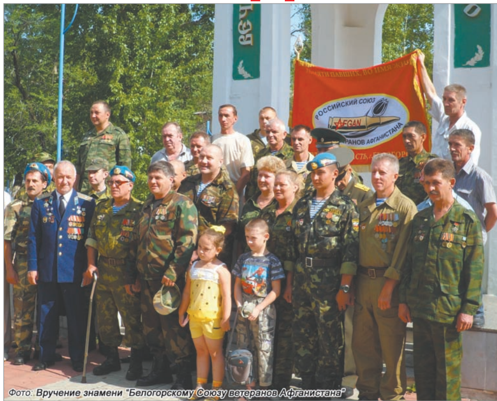
Фото: Вручение знамени «Белогорскому Союзу ветеранов Афганистана»

- Что касается администрации Белогорского района – то здесь с нами работают с удовольствием. Любое наше начинание они поддерживают на «ура». А вот с нынешним городским руководством понимания у нас не сложилось. Пусть мы не всегда высказываемся лицемерно о действиях некоторых чиновников, отстаиваем права ветеранов, критикуя неработающие законы, но всё же наши действия направлены на патриотическое воспитание. Недавно, кстати Президент России Владимир Путин на совещании, посвящённом вопросам нравственного и патриотического воспитания молодёжи, сказал, что строить это воспитание нужно на правде, даже если она неприятная. На самом высшем уровне обсуждаются эти вопросы, есть идея создания в России Военно-исторического общества. А у нас получается, что есть готовые военные общественные организации, так обратите на нас внимание, работайте с нами, мы готовы заниматься и занимаемся патриотическим воспитанием, но ограничены в финансах, ведь работаем мы на общественных началах. Мы себе зарплату не просим – но можно ведь включить «Зарницу», поездки в музей воинской славы, другие мероприятия в городской план работы и бюджет. Думаю, что на детей и их нравственную культуру и воспитание денег не должно быть жалко. Ими нужно и можно заниматься. Видели бы вы, как горят их глаза, когда проходят соревнования, когда они преодо-