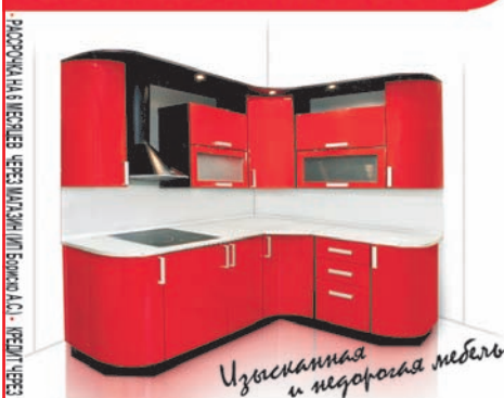
Изюминка и идеальная мебель