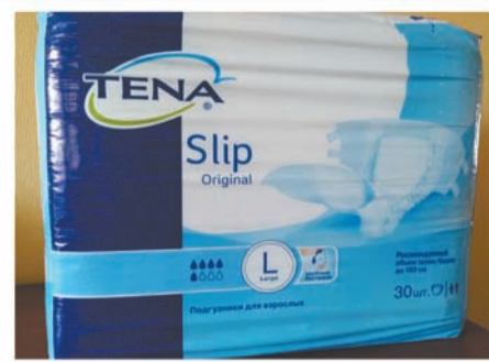
Продаются подгузники для взрослых, размер "L," (объем талии/бедер до 150 см), с полным влагопоглощением не менее 2000 г. Цена 1 упаковки (30 шт.) - 1 000 руб. В наличии 9 упаковок. Тел: 8-996-384-68-93, 8-914-569-90-00