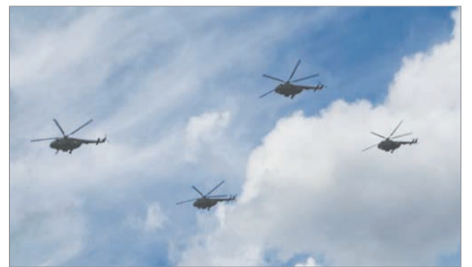
11:00 до 11:10 в Благовещенске и с 11:30 до 11:40 в Белогорске.

планированы тренировочные полеты по этому же маршруту с 12:00 до 14:00. Кроме того 7 мая зап-