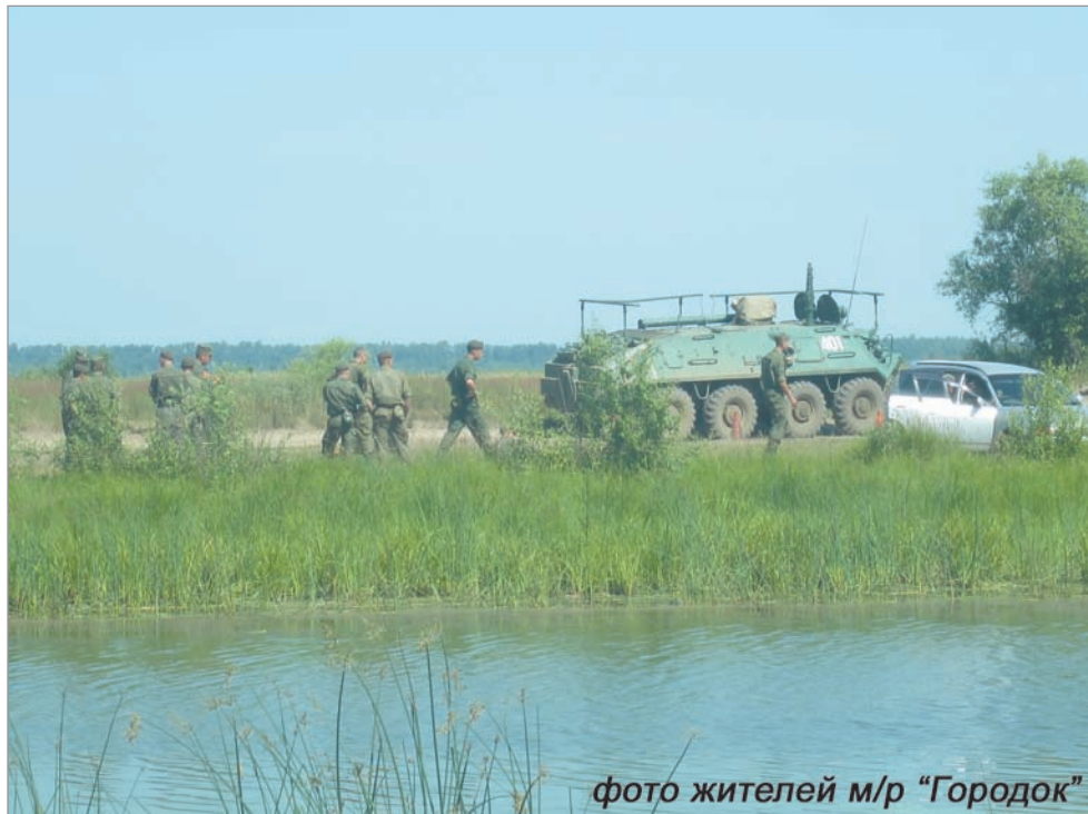
фото жителей м/р «Городок»

Дети жителей «Городка» лишены и отдыха на расположенном рядом озере, и возможности играть на детской площадке