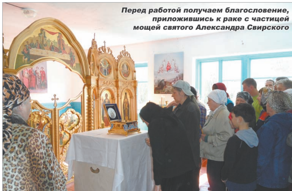
Перед работой получаем благословение, приложившись к раке с частицей мощей святого Александра Свирского

умытую землю. На небе ни облачка! Дорога не близкая, радуется природа. Кружево из молодой зелени нежно опустилось на деревья, пробегающие вдоль дороги. Зеленый ковер молодой травы укрыл землю, скрывая недавнюю ее серость. Желание поработать во славу Божию поднимает высокие струночки в душе, звенящие колокольчиками в сердце, создавая необыкновенно светлое настроение. С таким благостным настроением мы не заметили, как подъехали к селу Среднебелое, а от него через десять километров - наш пункт назначения - село Троицкое. У монастыря стоят автобусы и машины - этим транспортом приехали прихожане из храмов Благовещенска, Белогорска, Свободно-