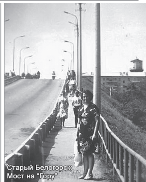
Старый Белогорск: Мост на "Гору"