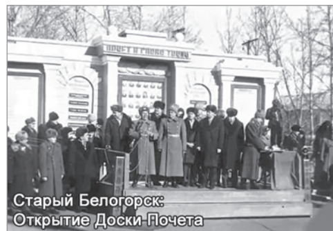
Старый Белогорск: Открытие Доски Почета