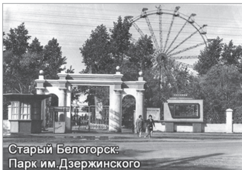
Старый Белогорск: Парк им.Дзержинского