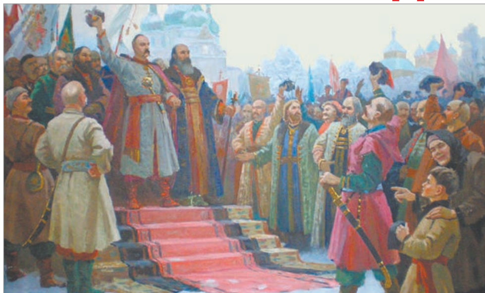
Собрание в Переяславле представителей украинского народа 18 января 1654 года, принявшее решение о воссоединении Украины с Россией

А что же украинские националисты? Как они отметились в истории? В 1929 году на Украине была создана организация украинских нацистов (ОУН), руководителем которой стал Андрей Мельник. Но уже в 1938 году пост руководителя занял Степан Бандера. В годы войны была создана украинская повстанческая армия (УПА), командующий —