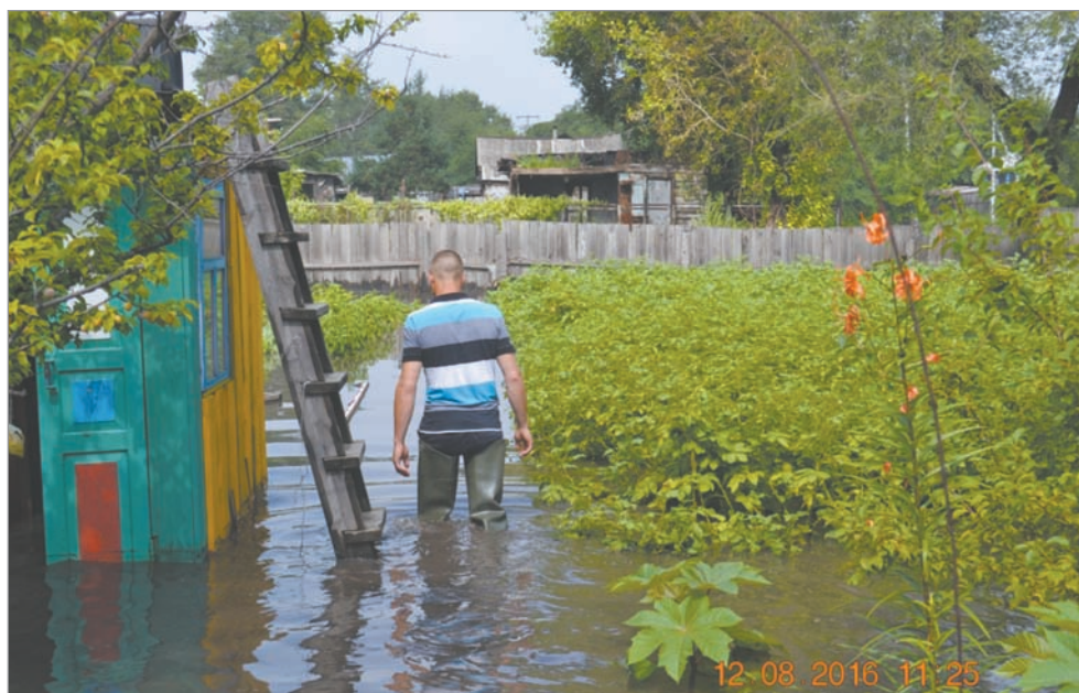
отведения сточных вод по ул. Куйбышева.

Между тем, редакция «Просто газеты», ответ на запрос которой поступает через 7, а не 30 дней, сделала запрос в Пресс-службу Главы города, с вопросом о том, запланированы ли в этом году работы по устройству водо-