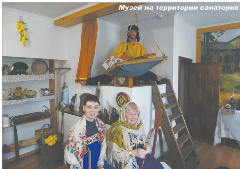
Музей на территории санатория

Организаторы мероприятия благодарят инспекторов 193 ВАИ (территориальная), которые второй год принимают участие в проведении городского слета отрядов ЮИД.